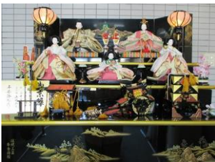
テーブルにもお雛様。(右)なんと、これはパズルになっていて、きれいに四角の箱におさまるんですよ！