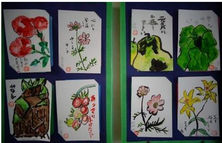
お客様の作品展示 絵手紙