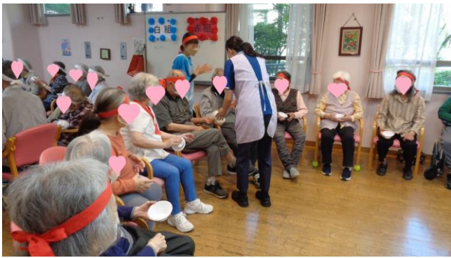
10月は運動会を開催しました！！

10月も運動会やゲーム大会、手工芸作品の作成に野菜作りまで活動内容は盛り沢山でした！！全てをご紹介できないのが本当に残念ですが活動のご様子をご覧ください！！