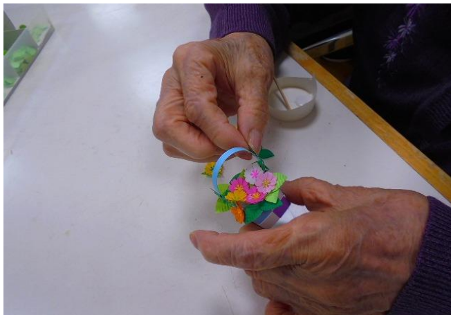
毎月、大人気の手工芸♪♪