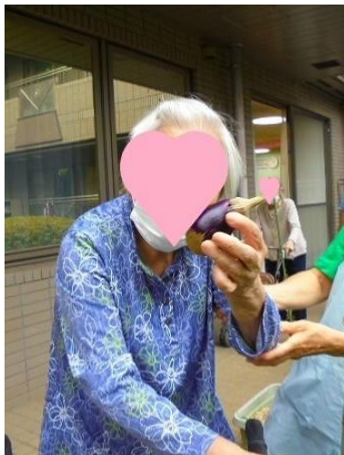
お庭で育った野菜の収穫♪