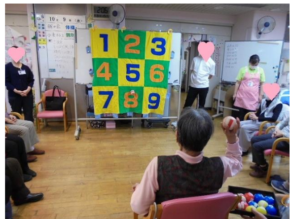
ゲーム大会も盛り上がりました♪