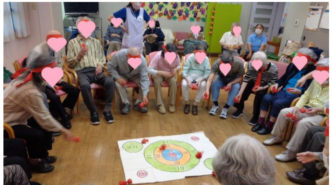
紅白に分かれて勝敗を競います！！