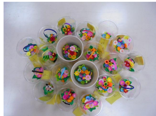
沢山並べても綺麗です♪