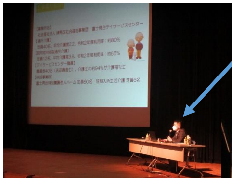
参加者約 1,200 名の前で、 高齢者虐待防止の取り組み 報告をしました。