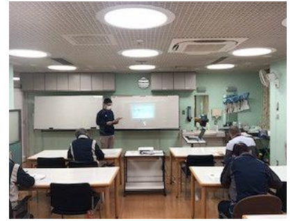
送迎員スキルアップ研修

富士見台デイは、安全運転管理者の所長が、5台の車輛と11人の送迎員を管理して業務を行っています。令和4年度も、ご自宅とセンター間を安全に送迎させていただきます。安心してご乗車ください。