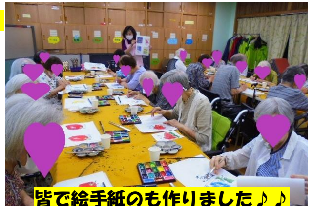
皆で絵手紙ののも作りました♪♪

☆今月は第三者機関によるアンケート用紙を『ふじみみ』と一緒にお渡ししております。封筒の中身をご確認いただき、記入後郵便ポストよりご発送ください。近くにポストが無いお客様はデイサービスにご持参いただければ、施設より発送を行う事も可能です。お手数をお掛けいたしますが何卒宜しくお願い申し上げます。