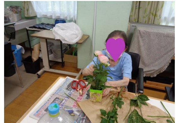
毎月好評のフラワーアレンジメントです