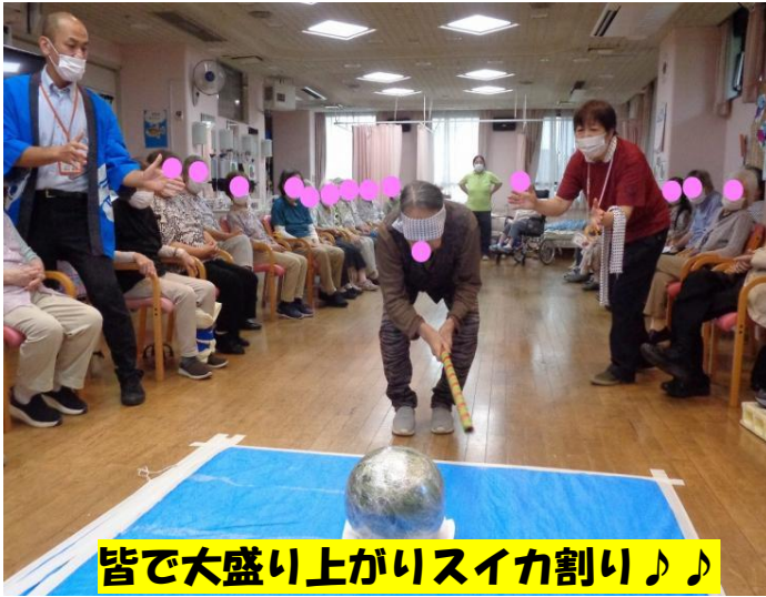
皆で大盛り上がりスイカ割り♪♪

8月の活動のご報告です♪♪今月は夏祭りを開催いたしました。盆踊りやゲーム、スイカ割りもとても盛り上がりました。その他にも沢山の活動を行いましたので是非ご覧ください。♪♪