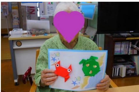
折り紙で季節の作品作り♪♪