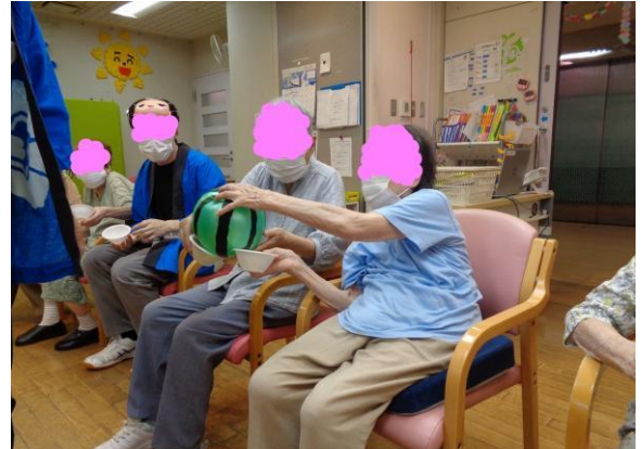
夏祭りのゲームも楽しかったです♪