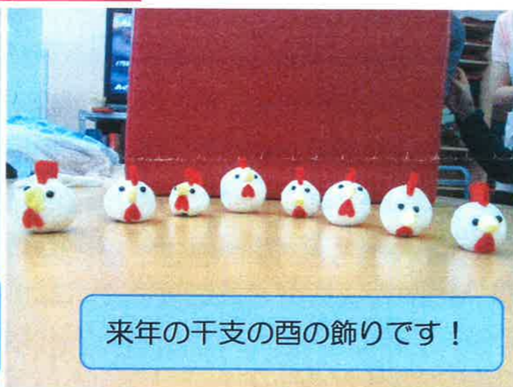
来年の干支の酉の飾りです！