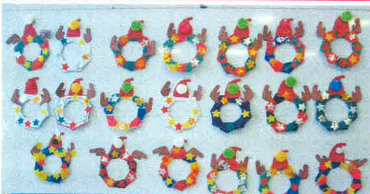
職場体験に来られた近隣の中学生と一緒にクリスマス飾りを作りました。