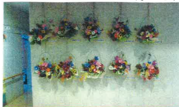
フラワーアレンジメント作品

センターへ来所されると、お客様の多くが足を止められて作品を眺めておられます。「これ、とても上手よね。」「私も、この前作ったわ。」など、笑い声が聞かれます。デイサービスへお立ち寄りの際には、ぜひ作品展示会までいらしてください。