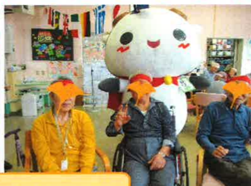
練馬区のキャラクター「ねり丸」が今年も来てくれました!