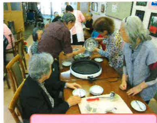
おやつ(チヂミ)作り