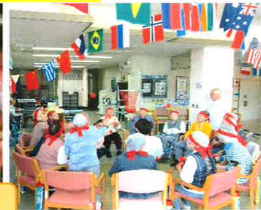
紙相撲と玉入れ 白熱する戦い!