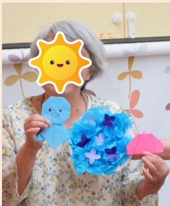
七夕の飾り物作り

その方のその時に合った活動を提供しています。職員となら交流できる方、作業に集中したい方、不安を聴いてほしいなども対応しています。