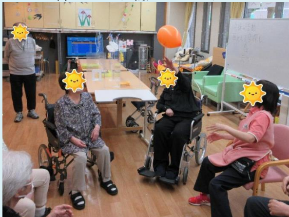
皆さんで風船バレー！ルールは簡単だけど盛り上がり