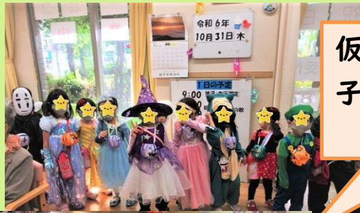
仮装をして保育園の子供たちの訪問!