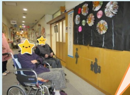
～作品展～ アートフェスティバル鑑賞 お誕生会やカレンダー作りもしました!