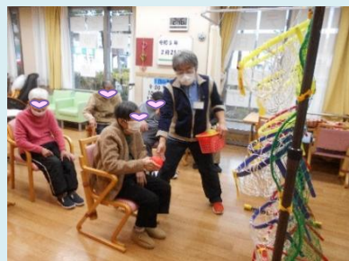
ポケネットゲーム