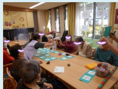
玉を投げたり ことわざを 思い出したり