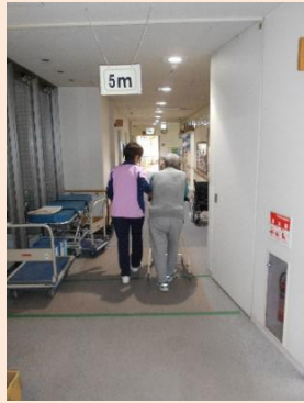
片道15mの廊下で 午後の歩行練習です

その方のその時に合った活動を提供しています。職員となら交流できる方、作業に集中したい方、不安を聴いてほしいなども対応しています。