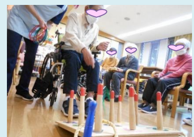
輪 投 げ