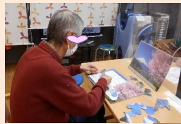
ジグソーパズルを 楽しめることが ありました