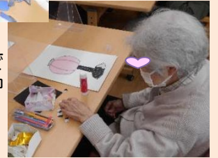
ご自身のペースで 貼り絵に集中