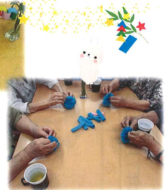
指先に集中して作成中