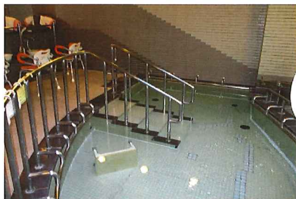
浴槽へは5段の階段 職員が見守り致します