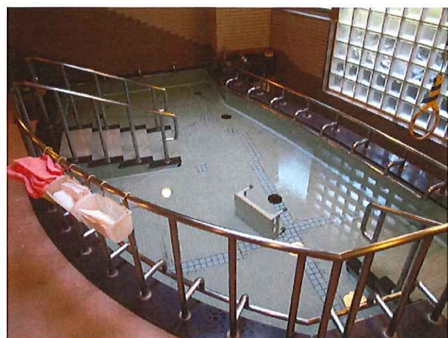
お客様に好評。大きなゆったりした浴槽です