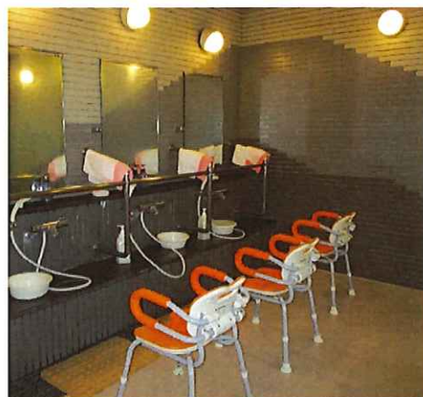
手の届かない場所の洗身はお手伝いいたします