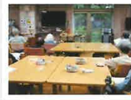
ボランティアの方による ギター＆歌の会