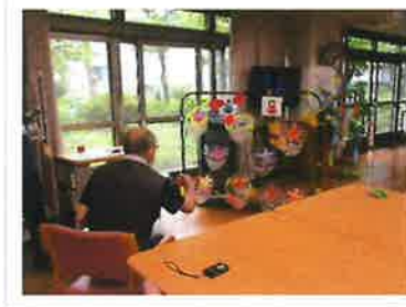
七夕行事 ～ポケネットゲーム～