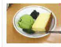
いつもよりちょっと 豪華なおやつの日!!