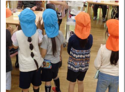
(上) 春の天ぷらのご昼食！やっぱりアスパラは美味しかったとのことでした。 (下) さくら幼稚園の子供たちが遊びに来てくれました！可愛いお客様に、目じりが下がってしまいましたね。