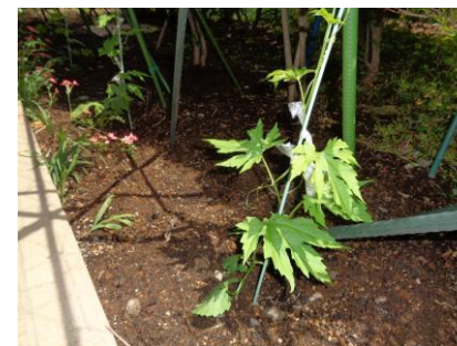
(上) 30枚すべてのカードすべてを使って完成させる「しりとりゲーム」は、かなり難しく、頭を悩ませていらっしゃいました！ (下) ゴーヤのグリーンカーテンプロジェクト、今年も始まりました！大きくなあれ(*^_^*)