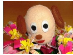
「発犬君」 田柄デイサービスセンター マスコット