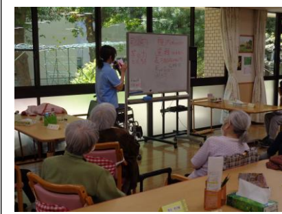
(上)「言葉集めゲーム」は「4文字の食べ物」などお題の言葉を探します。お仲間同士で話が弾みます！ (下) 体操の途中にも皆様に脳トレ問題をご提供！職員がそれぞれ毎日考えているんです。