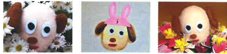
「発犬君」 田柄デイサービスセンター マスコット