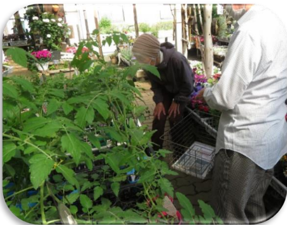
中庭に植える夏野菜の苗の買い出しに行きました。