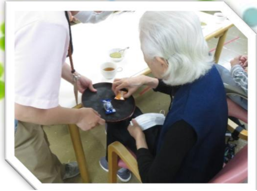
各曜日で上位 3 名様にアイスの「ピノ」が、 景品で出ました