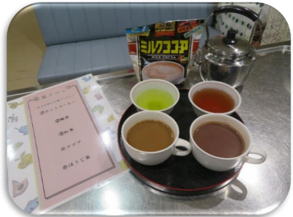
今月から始まった「喫茶週間」 コーヒー・ココア・緑茶等好きな飲み物を選 んでいただきました。