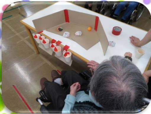
5月のゲームはピノ争奪ゲーム！ これが結構難しい！