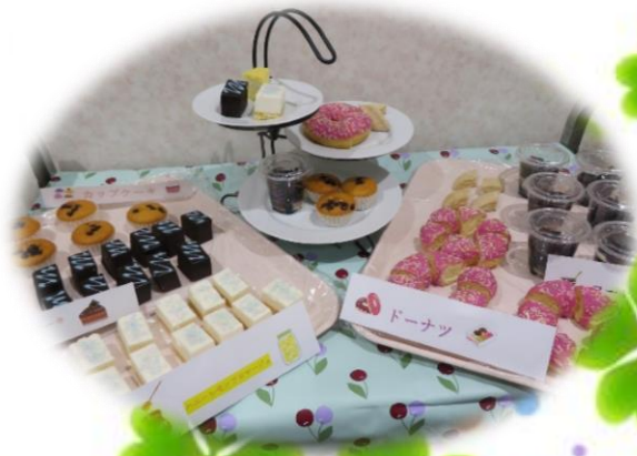
今月のお楽しみおやつは 「スイーツバイキング」