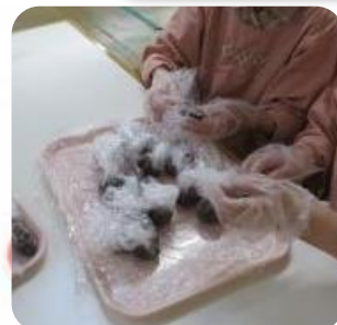
おやつ作りは 「あんこ巻き」 混ぜて・丸めて・美味しく焼き上がり！