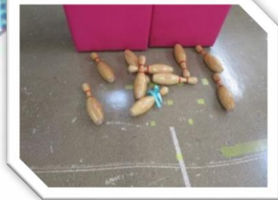
今月のゲームは 「ボウリング」 球、結構重いんですヨ