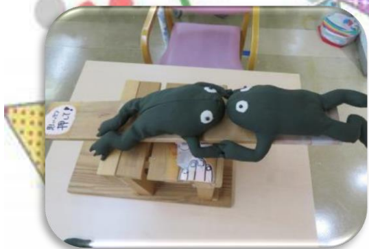
梅雨の時期恒例の 「カエル飛ばしゲーム」 カエルですが飛ばすのは難しいんです！