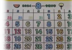
8月のカレンダーは茄子