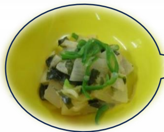
ある日の昼食 自家製モロコインゲンが りました！